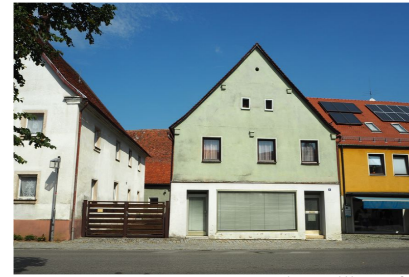
Leerstand Hauptstraße 4