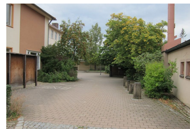
Hofsituation Schule / St. Marien