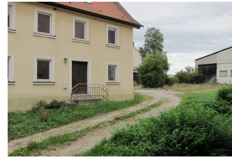
Fl.-Nr. 57 -Schulgasse 2