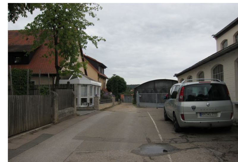
Am Anger-Zufahrt zu Haus-Nr. 5 -10