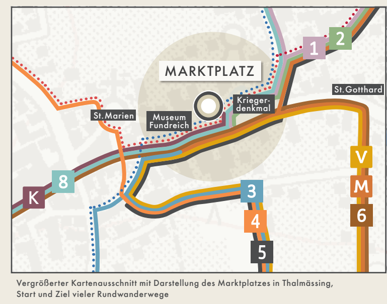
Vergrößerter Kartenausschnitt mit Darstellung des Marktplatzes in Thalmässing, Start und Ziel vieler Rundwanderwege