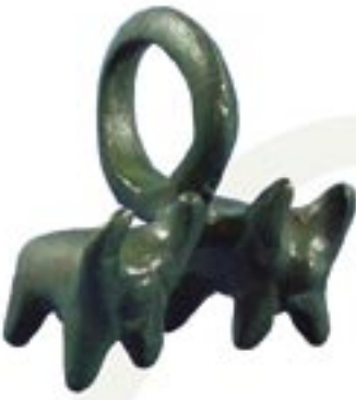
Keltischer Schmuckanhänger aus Bronze (450–350 v. Chr.) 1983 bei der Freilegung von Gräbern aus der frühen Kelten- zeit bei Landersdorf gefunden.