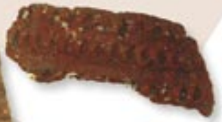
Überreste tönerner Vorratsgefäße (etwa 3500–2700 v. Chr.)