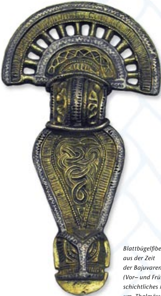
Blattbügelfibel aus der Zeit der Bajuwaren (Vor- und Frühge- schichtliches Muse- um, Thalmässing)

Im Zuge des Eisenbahnbaus 1887 wurde in Thalmässing ein bajuwarisches Reihengräberfeld des 6. bis 7. Jahrhunderts n. Chr. entdeckt.