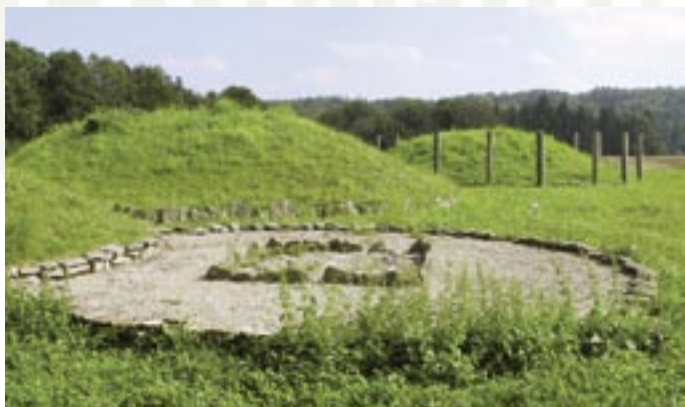
Gräberfeld aus der frühen Eisenzeit bei Landersdorf

Das Gräberfeld von Landersdorf stammt aus der frühen Eisenzeit (ca. 750 v. Chr) und wurde bis in das 5. Jahrhundert v. Chr. belegt. Die archäologischen Untersuchungen des Gräberfeldes begannen 1984 durch die NHG und wurden vom bayerischen Landesamt für Denkmalpflege bis 1987 fortgeführt. Den Abschluss bildete die Rekonstruktion der Grabhügel. Die dazu gehörende Siedlung auf der Göllersreuther Platte ist nur teilweise archäologisch erfasst, die Grabungen dauern noch an.