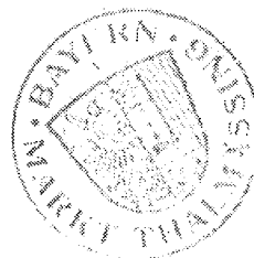
Georg Küttinger Erster Bürgermeister